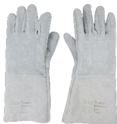
Luva de Proteção para Soldador MIG