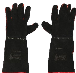
Luva de Couro Sumig Fire