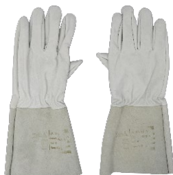
Luva de Proteção para Soldador TIG